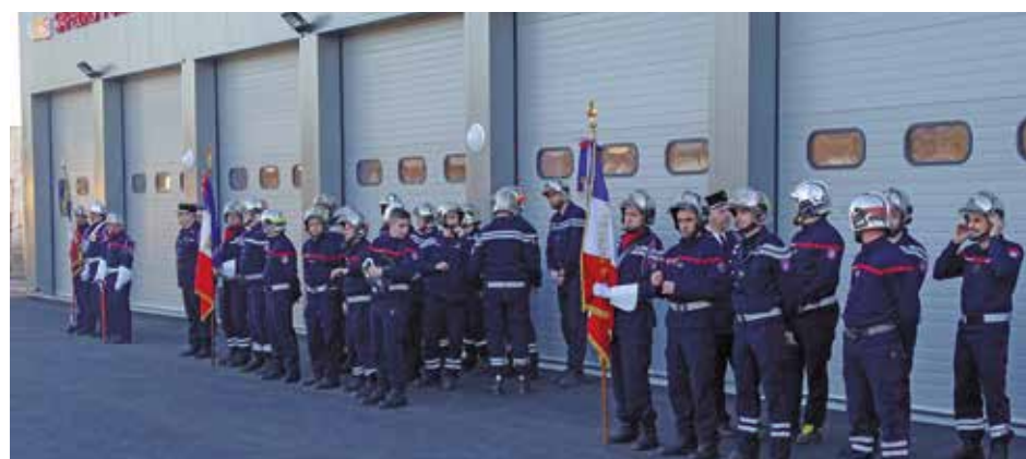
L'inauguration de la nouvelle caserne s'est tenue le mercredi 23 février.