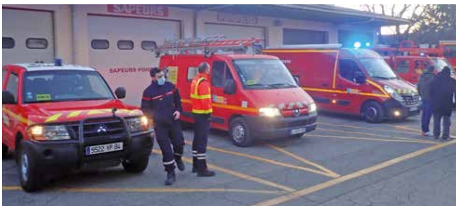
Départ de la caserne Raphaël Denis à Althen.

Après une photo souvenir en présence des élu(e)s de la commune, M. le Maire, souffrant étant excusé, les pompiers ont défilé dans le village au son des sirènes pour un au revoir retentissant et joyeux. Ils ont ensuite rejoint leurs homologues Entraiguois à la nouvelle caserne où chacun a pu prendre ses quartiers. Avec ce transfert réussi, une page se tourne dans l'histoire des pompiers Althénois. Bien que nos pompiers soient désormais basés à quelques kilomètres du centre-ville d'Althen, cela ne changera en rien leur engagement au service de la population.