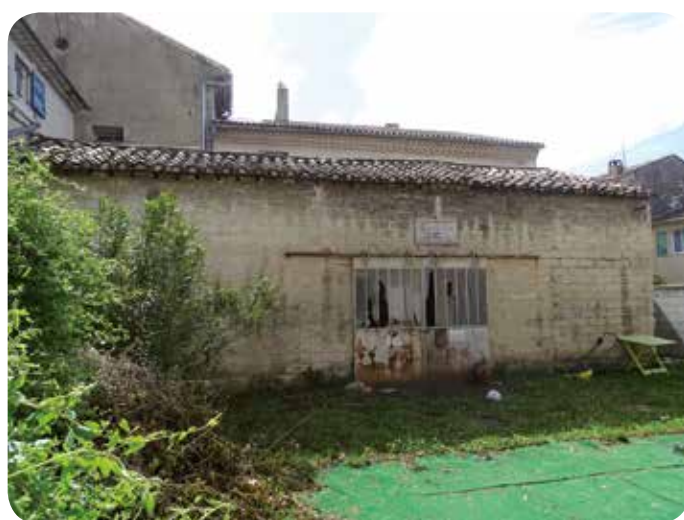
La Forge. Une rénovation urgente !

NB: La PPI revêt naturellement un caractère évolutif et devra être réexaminée chaque année afin de prendre en compte les inévitables obstacles (administratifs, juridiques, etc.) que nous pourrions rencontrer et qui viendraient retarder la mise en œuvre des projets.