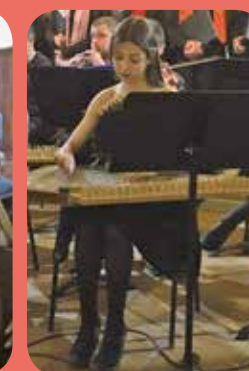
L'Orchestre Sassoun et la Chorale Azad