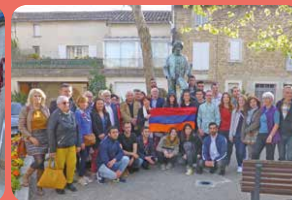
Vernissage de l'exposition sur la garance