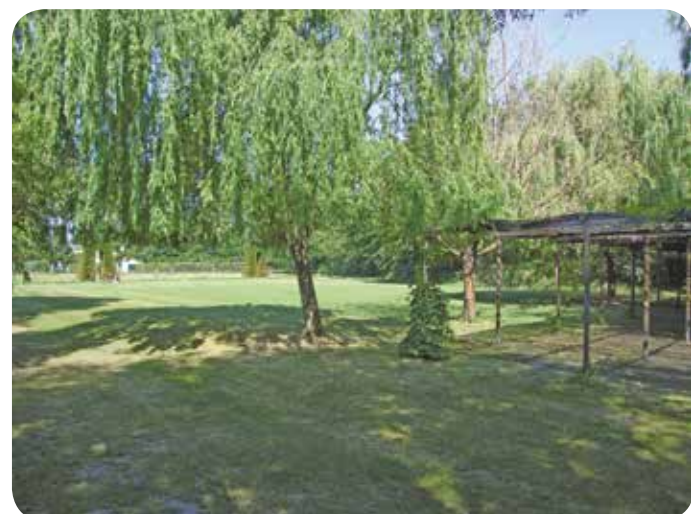
Pré aux chênes (photo non contractuelle)