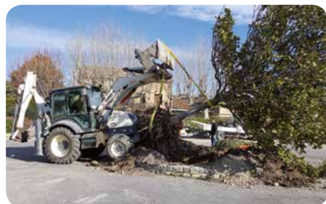
Déplacement du magnolia