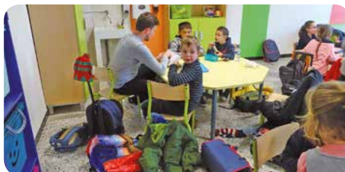
L'accueil de loisirs (ALSH). Des locaux à agrandir...

Les projets décrits au point 4 font l'objet d'études en cours. Les premiers paiements ne devraient pas intervenir avant 2020. La priorité sera donnée au restaurant, à la cuisine scolaire, ainsi qu'à l'ALSH.