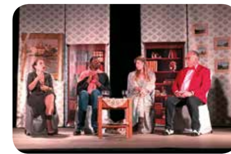
Le bal des crapules