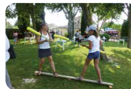
Jeux pour les enfants