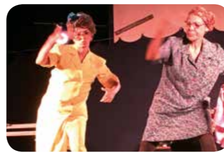
Le dialogue des Marguerite